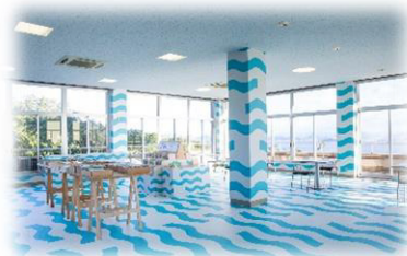
mt cafe at 王子が岳