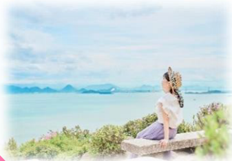
王子が岳からの絶景