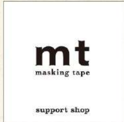
このフラッグがサポートショップの目印です。

今回のfactory tour開催にご賛同いただいた倉敷のショップです。 passをお持ちのお客様は、各ショップの条件をクリアして頂くと ショップ特製オリジナルmtをプレゼントします。 ぜひ足を運んでみて下さい。